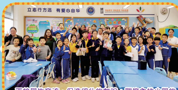
兩校學生交流，促進彼此的友誼；觀摩內地小學的設施及活動的情形，具體地認識內地的學習生活