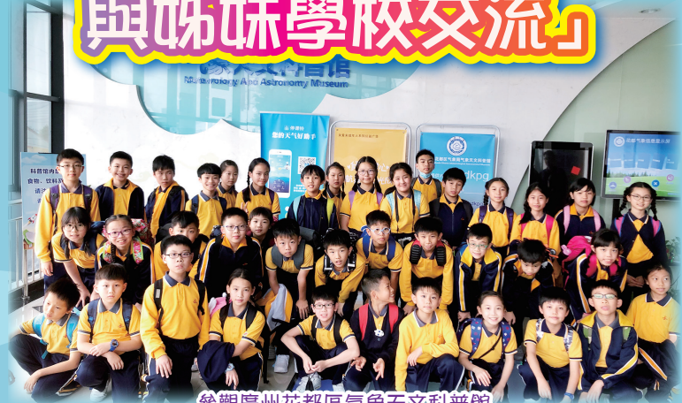
參觀廣州花都區氣象天文科普館