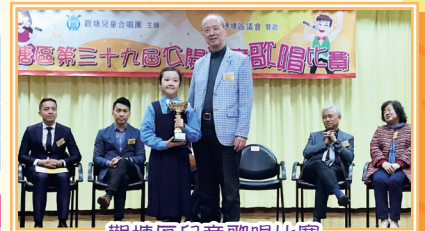
觀塘區兒童歌唱比賽