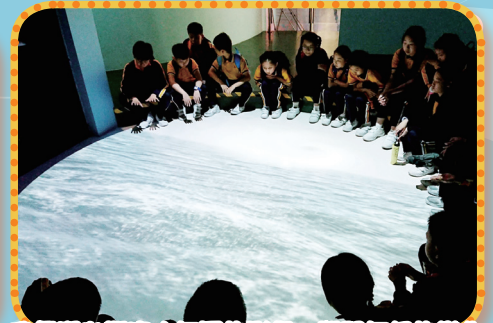
我們留心觀察大氣層的影像，學習氣候的變化