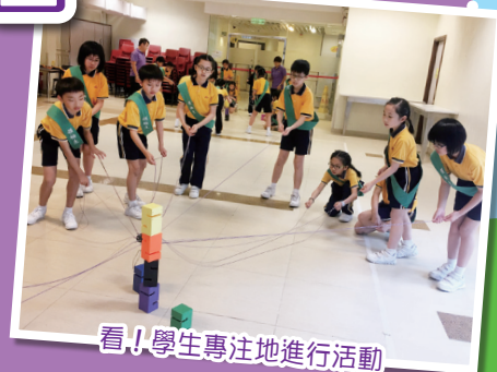
看！學生專注地進行活動