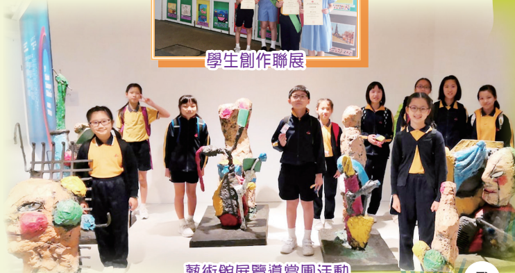
藝術館展覽導賞團活動