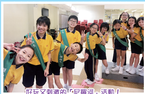
好玩又刺激的「尼羅河」活動！

為了提升領袖生的領導才能及解難能力，成為名副其實的領袖，30位五年級學生於4月10日在北潭涌度假營舉辦了領袖生訓練日營。學生通過不同類型的歷奇訓練活動，學習到作為領袖所需要的技能和特質，從中明白到領袖生不單是一個獨立的精英個體，更是一個能引領團隊衷誠合作的關鍵人物，亦體會到團隊精神的重要性。