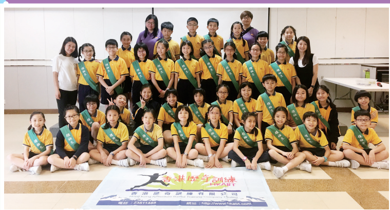
學生經歷一整天的活動後，變得更有自信心！