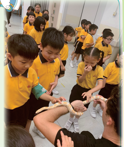
P1 students petting a snake. Scary!