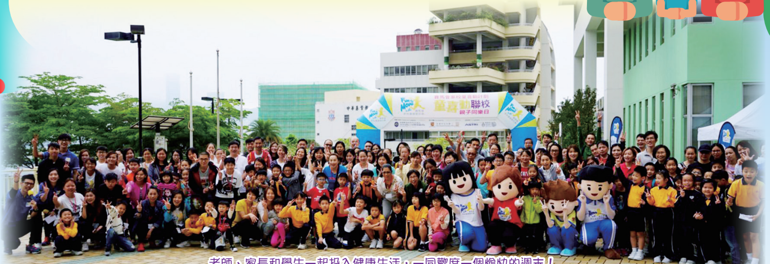
老師、家長和學生一起投入健康生活，一同歡度一個愉快的週末！