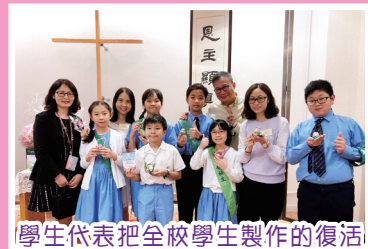
學生代表把全校學生製作的復活彩蛋送到聯合醫院

在復活節前，低年級學生和家長設計了精緻的復活彩蛋，而高年級的學生則在紙條上寫上祝福的字句，放進復活彩蛋內，送給聯合醫院的病人，向他們送上祝福和耶穌復活所帶給人的盼望。「施比受更為有福」(使徒行傳二十章35節)，這次送蛋行動讓學生實踐了關懷社區有需要的人。