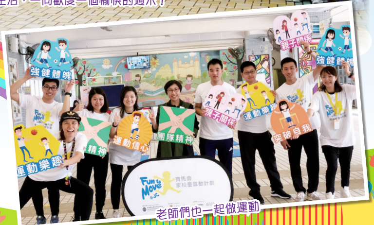
老師們也一起做運動