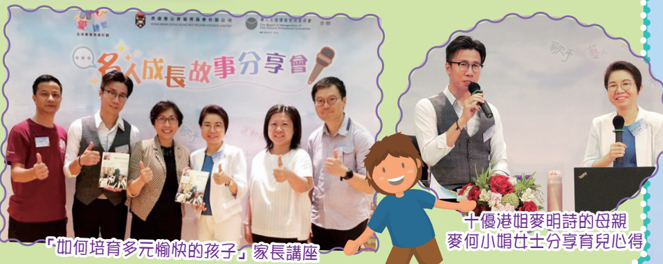
「如何培育多元愉快的孩子」家長講座