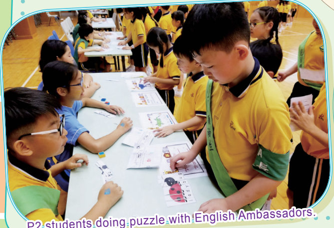
P2 students doing puzzle with English Ambassadors.