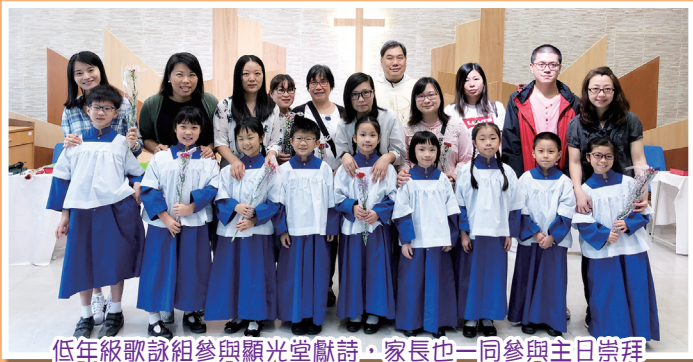
低年級歌詠組參與顯光堂獻詩，家長也一同參與主日崇拜

學校舉辦不同的宗教活動，讓學生認識福音，加深對信仰的理解，又與聖公會基督顯光堂保持緊密的聯繫，鼓勵學生參與教會活動。