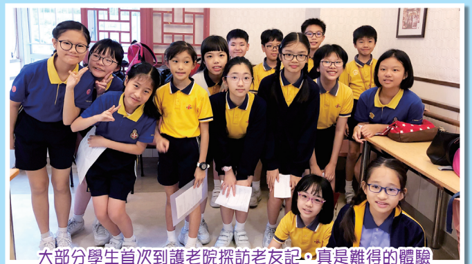
大部分學生首次到護老院探訪老友記，真是難得的體驗

11位基督女少年軍聯同4位小魔術師於5月4日探訪聖公會恩慈長者之家，他們和老友記一同唱歌一同玩節奏樂器。老友記們在遊戲環節中開心動腦筋，小魔術師的表演出神入化，大家樂也融融。