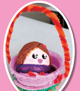
很可愛的復活蛋啊！