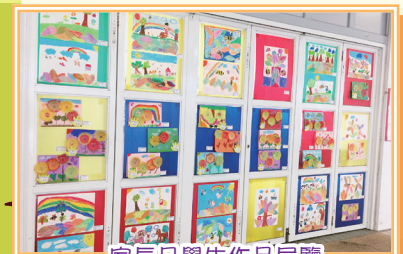
家長日學生作品展覽