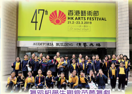
舞蹈組學生觀賞芭蕾舞劇