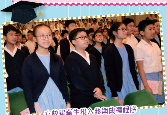
六校畢業生投入參與典禮程序

其實，局長的勉勵是適用於我們全校學生，就讓我們一同為自己的學習努力，並積極保護環境，源頭減廢，共同建設更美好的香港。