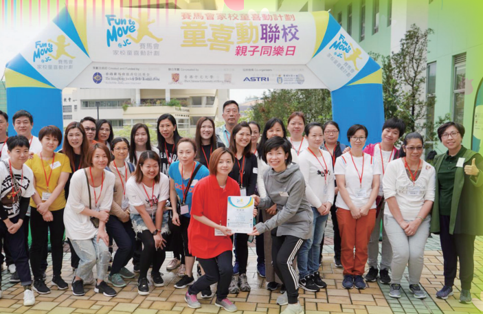
感謝我家的家長義工