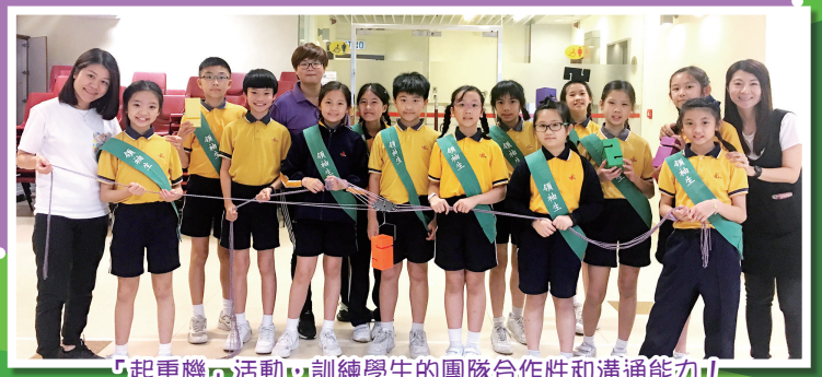
「起重機」活動，訓練學生的團隊合作性和溝通能力！