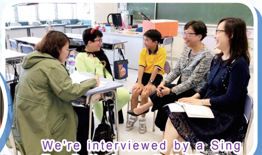
We're interviewed by a Sing Tao Daily journalist! What an extraordinary experience!