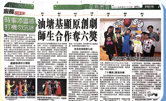
Sing Tao Daily reported our achievement! We are so thrilled!

Please pay close attention to our next recruitment in September, 2020!