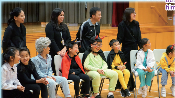
We'd a happy chat with the adjudicators after the performance!