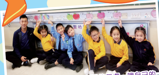
學生在蘋果卡上寫滿了自己的長處，讓自己的長處得以發光發亮！

此活動分三個階段進行，第一階段是多運動、多吃健康食物(食指)，學生在小息時都多吃健康小食，例如水果和乾果。第二階段是多感恩、多分享(尾指和無名指)。透過填寫感恩卡，以及跟不同老師分享他們的感恩事，學生學會了凡事感恩。學生大使於小息時讀出學生的感恩卡文字，讓校園充滿了感恩的氛圍。第三階段是多發揮長處、多讚賞(中指和拇指)，透過填寫自己的長處在蘋果卡上，以及填寫讚賞卡讚賞同學或老師，學生學會了解自己的長處，運用自己的長處去服務他人、欣賞別人，與人建立和諧關係，豐富生命的意義。