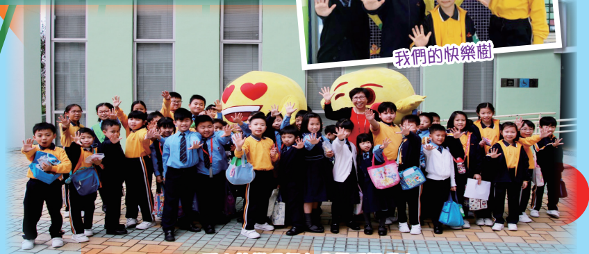
看！快樂已經在我們手裡了！