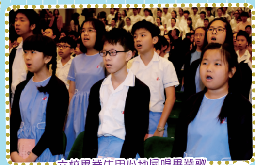
六校畢業生用心地同唱畢業歌