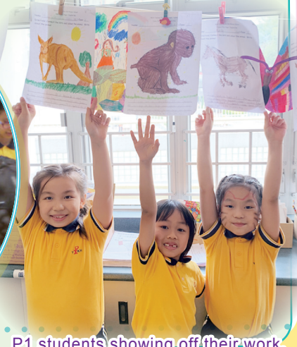
P1 students showing off their work.