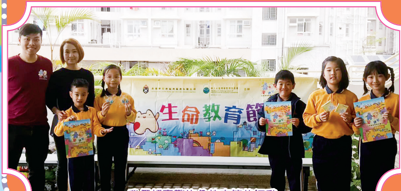
我們都喜歡生命教育節的活動