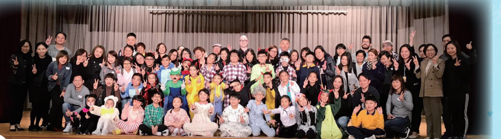
We've 29 students in our drama team. What a big production!