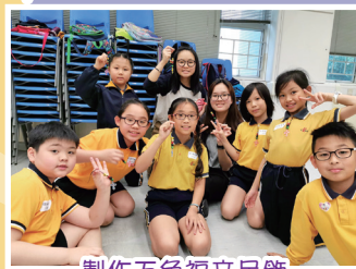
製作五色福音吊飾

本校和香港聖公會基督顯光堂合辦之復活節福音日營於4月13日舉行，主題為「尋找復活耶穌」，有69位四年級學生參加。當日節目內容豐富，讓學生明白天父對人的愛心及主耶穌為我們捨身的意義。