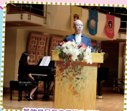
黃錦星局長為畢業生訓勉