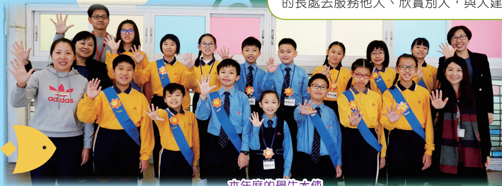
本年度的學生大使