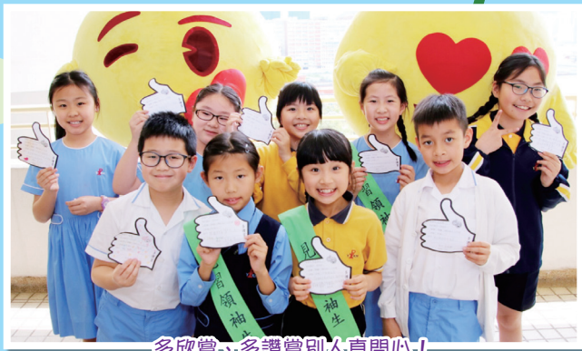
多欣賞、多讚賞別人真開心！