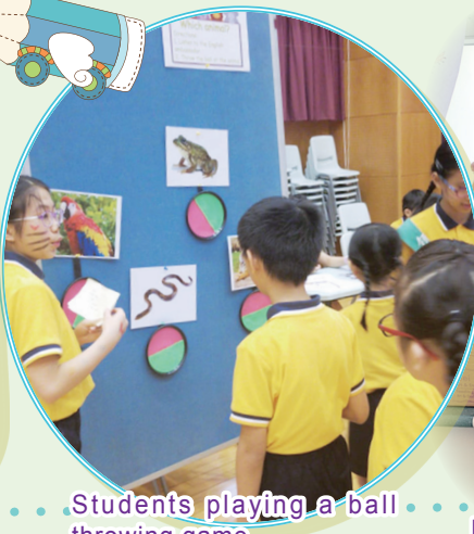
Students playing a ball throwing game.