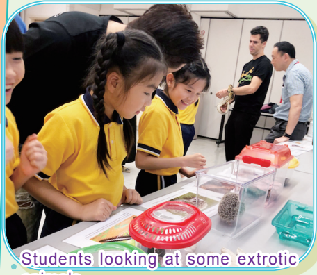
Students looking at some exotic animals.

We also had game booths and face painting. The children loved getting their faces painted like animals. They also played many games that helped them learn English in a fun and interesting way. Our English Ambassadors talked in English with the students to help them play the game. It was a very fun day!