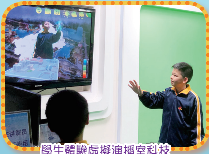
學生體驗虛擬演播室科技