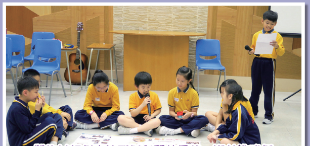
學生以話劇表達耶穌與門徒最後一次共進晚餐