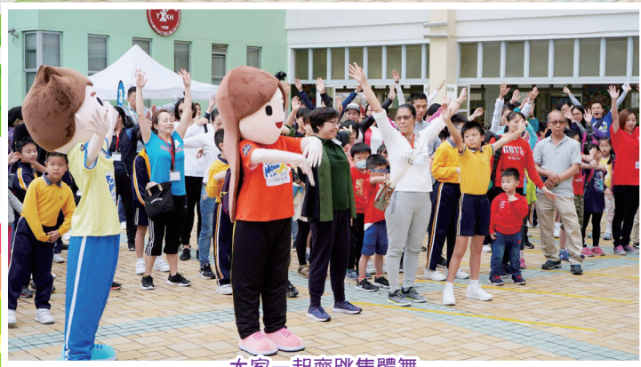
大家一起齊跳集體舞