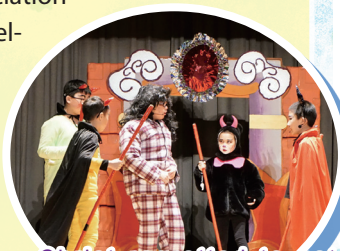
Christ regretted to get addicted to video games, but the demons didn't let him go.