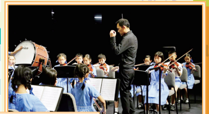
管弦樂團參加 聯校音樂大賽