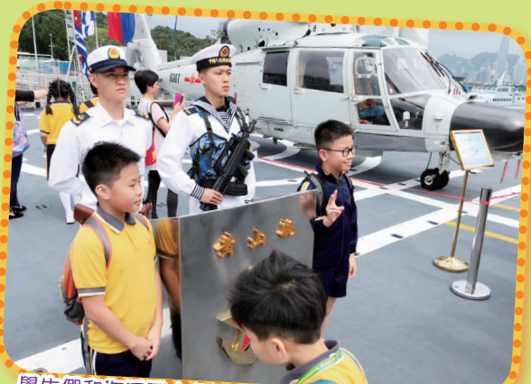
學生們和海軍戰士合照，臉上露出了滿足的笑容