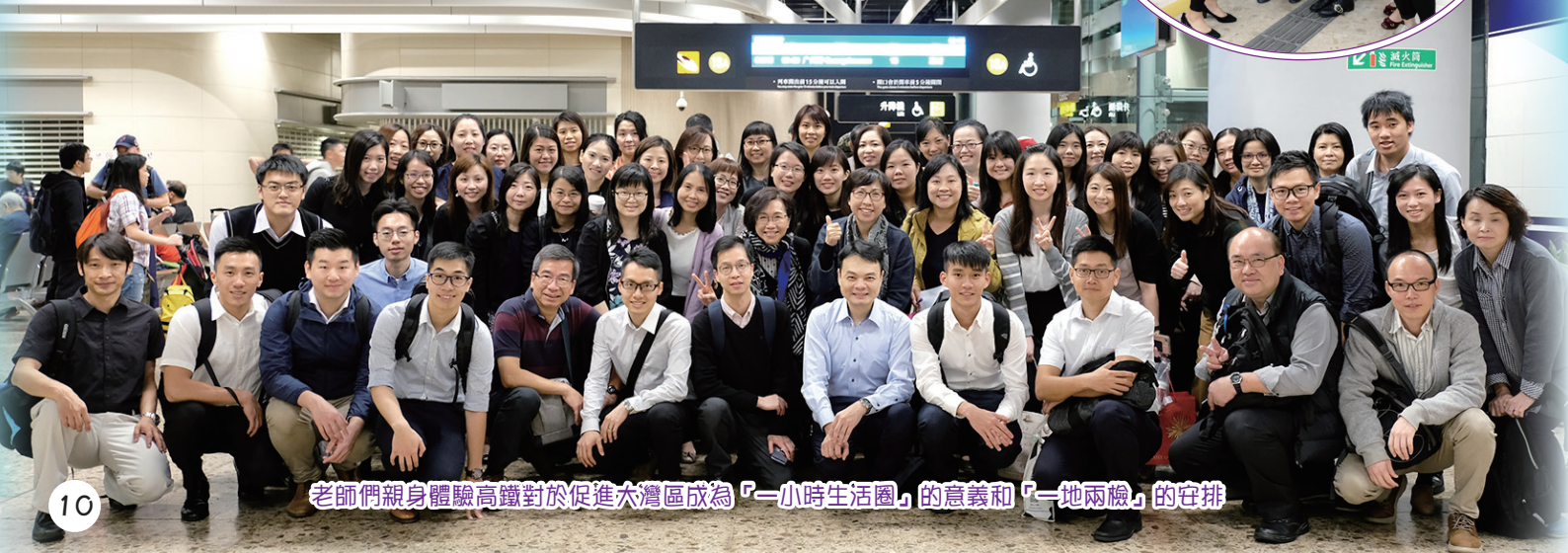
老師們親身體驗高鐵對於促進大灣區成為「一小時生活圈」的意義和「一地兩檢」的安排