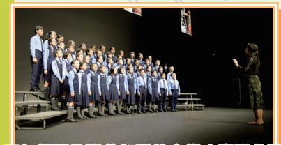
高年級歌詠隊參加聯校音樂大賽獲金獎