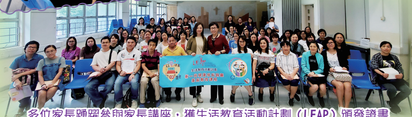
多位家長踴躍參與家長講座，獲生活教育活動計劃 (LEAP) 頒發證書