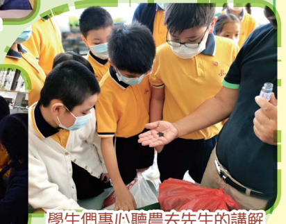
學生們專心聽農夫先生的講解