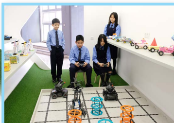
看誰的機械人最快完成解難任務吧！