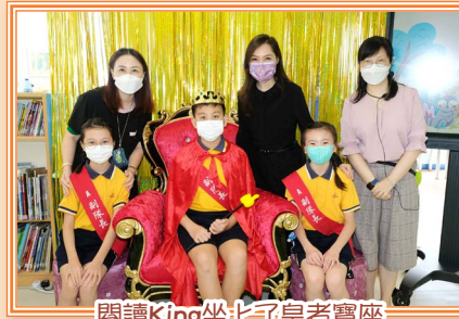
閱讀King坐上了皇者寶座