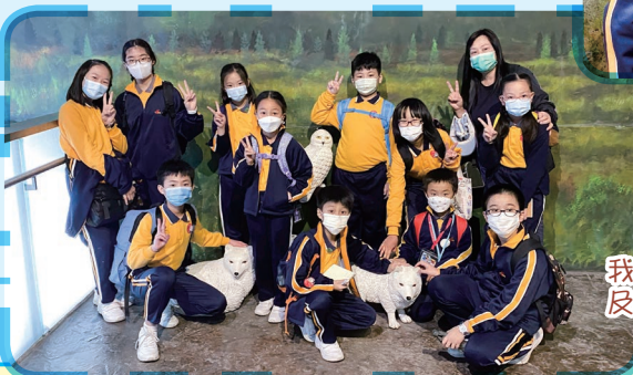
我們在「冰極天地」觀看企鵝及其他海洋生物