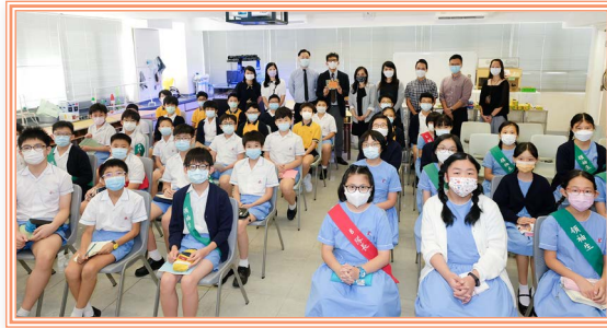
寧波第二中學校長和老師與我們合照

為加強六年級學生對區內、區外中學的認識，學校於11月份舉行四次「校本中學巡禮」，邀請十六所中學的校長和老師到校進行學校簡介。學生透過參加「校本中學巡禮」，增加對中學的課程編排、活動安排及收生要求的瞭解，儘早為升中做好預備，發揮自己的潛能。