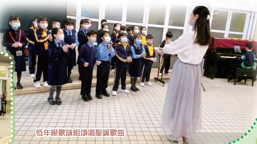
低年級歌詠組頌唱聖誕歌曲

當天，學生以鋼琴和木片琴為低年級歌詠組伴奏，更有 Beatbox 演出。觀眾反應熱烈，沉醉於同學的演出，並滿心期待下一次的音樂會呢！