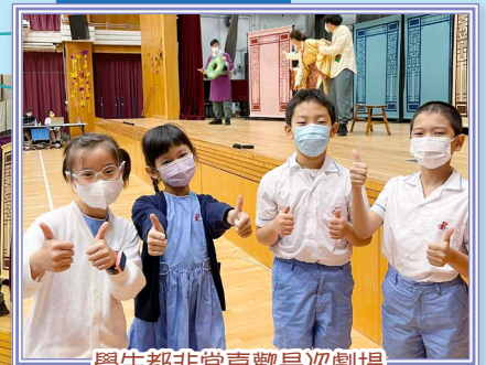
學生都非常喜歡是次劇場