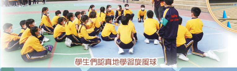
學生們認真地學習旋風球