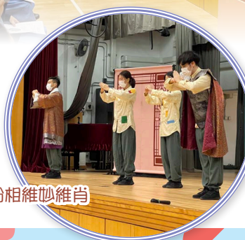
演員穿上古裝，扮相維妙維肖