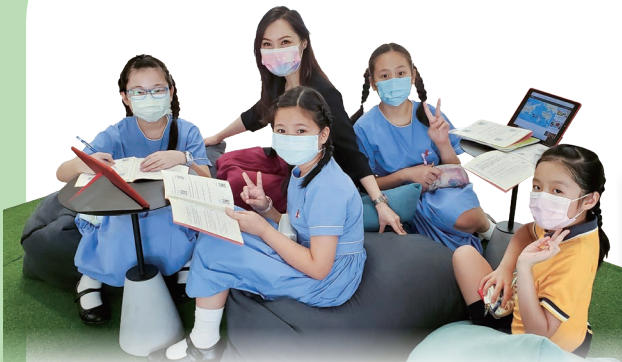
學生在多元智能自學中心進行各式各樣的自學活動，提升自主學習能力

為了讓學生在多元化的學習活動中，建構自主學習能力，並提升學習興趣，本校申請了優質教育基金，成立「多元智能自學中心」。「自學中心」已於九月份啟用，學生在老師的指導下，在這個嶄新的設施中，體驗自主學習的樂趣。