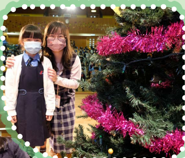
老師和學生到台上佈置聖誕樹

為迎接聖誕節的到來，學校進行了「佈置聖誕樹活動」。一、二年級學生在禮堂內投入地參與活動，在歡樂的氣氛下一同頌唱詩歌和認識耶穌基督為我們降生的大喜訊。每位學生臉上都洋溢着喜樂的笑容！