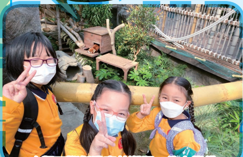
人類不斷耗用森林資源，令小熊貓失去棲息地，所以我們要好好保護這種瀕危絕種的小動物