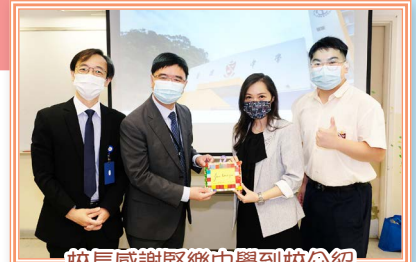
校長感謝堅樂中學到校介紹