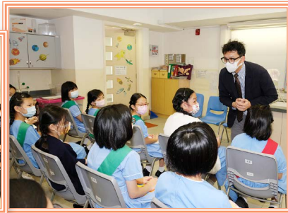
寧波第二中學到校為我們介紹