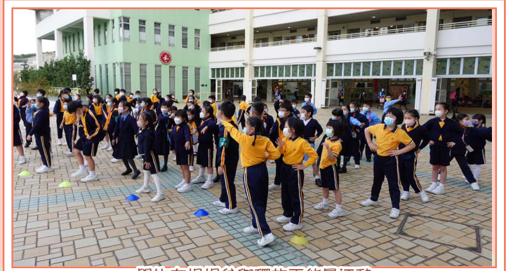
學生在操場參與釋放正能量活動