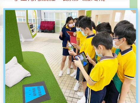
學生用平板電腦進行數學科的自學活動