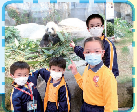
大熊貓：「你們想和我一起吃竹葉嗎？」

學生在園區內看到那些可愛的動物，真不希望失去牠們，所以下定決心要努力實踐環保生活，做地球的小管家。