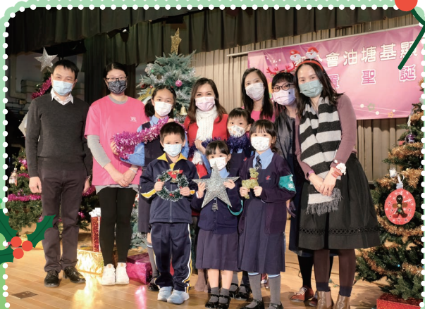
家長代表和我們一同佈置聖誕樹