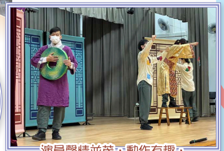
演員聲情並茂，動作有趣，同學更投入其中