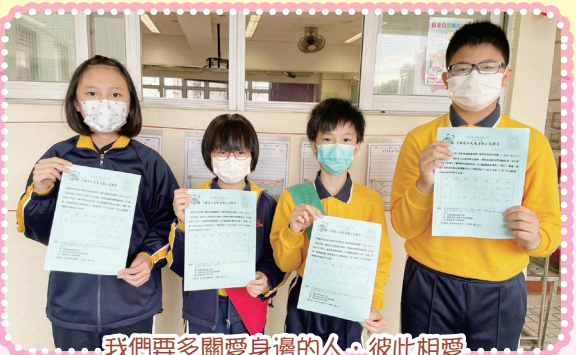
我們要多關愛身邊的人，彼此相愛

本年度全校學生一同參與「關愛小天使」活動，讓學生們在充滿「愛」的環境，以行動去關愛身邊的人，藉此培養他們推己及人和愛與關懷的精神。