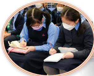
學生認真地記下升中要點