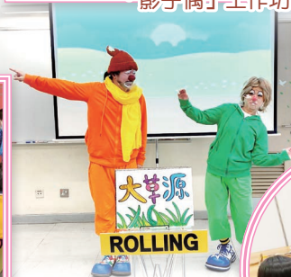
表演劇場十分精彩