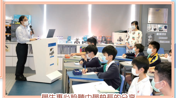
學生專心聆聽中學校長的分享