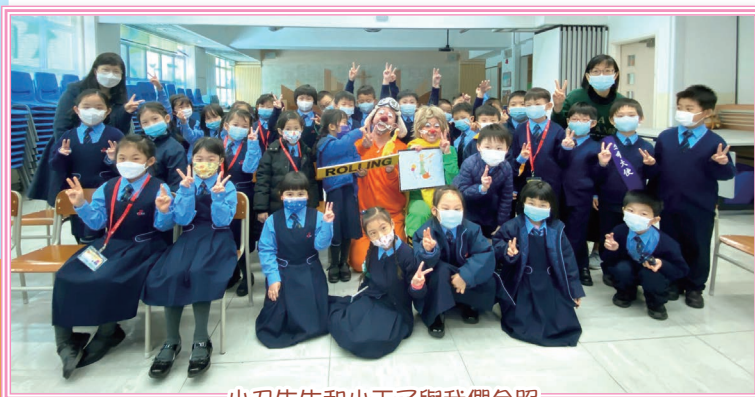
小丑先生和小王子與我們合照