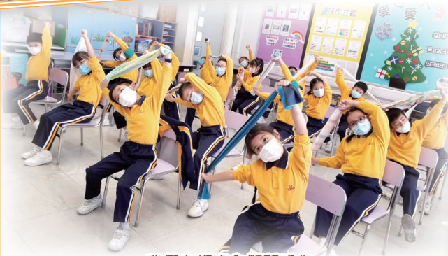
我們在課室內學習瑜伽