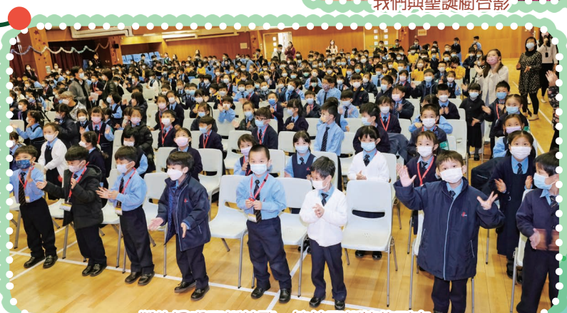
學生同唱聖誕詩歌，迎接聖誕節的到來