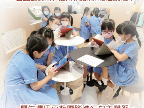
學生運用平板電腦進行自主學習，享受不一樣的學習體驗