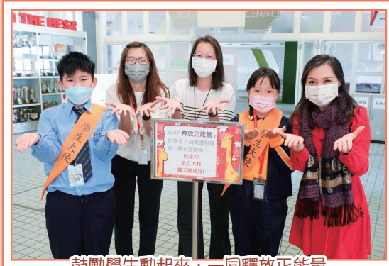
鼓勵學生動起來，一同釋放正能量

在第一段考試的前一週，輔導組透過「釋放正能量」活動，教學生做一些簡易的伸展動作、鬆弛練習。目的是融滙正向的訊息，希望學生在考試前，掌握一些自助減壓的方法。