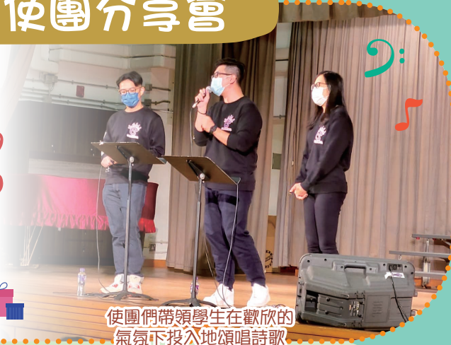
使團們帶領學生在歡欣的氣氛下投入地頌唱詩歌