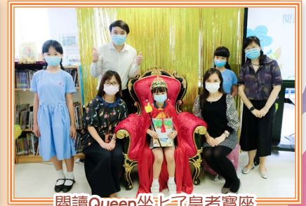
閱讀Queen坐上了皇者寶座