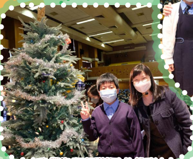
我們為聖誕樹添上色彩