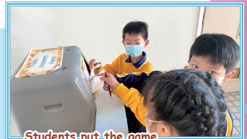
Students put the game sheet into a box

These games such as crossword and word search puzzles are very popular in both lower and upper primary levels. As students who participate in the winning class can get a prize, they are motivated to help their classmates solve the riddles. Students are very excited to earn more points to win the challenge and always look forward to the next one.