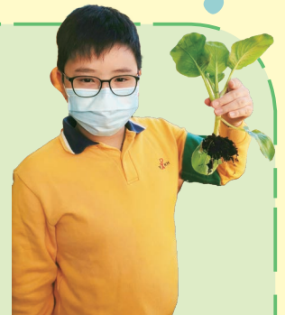
所種的芥蘭終於可以收成了