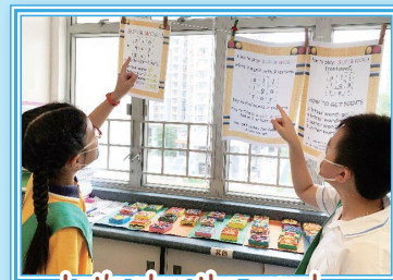
Let's play the game!