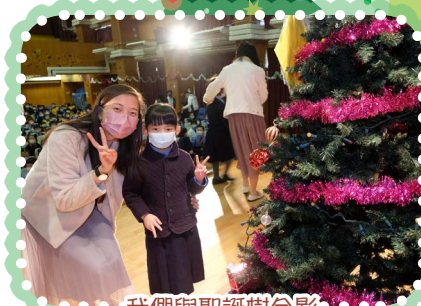
我們與聖誕樹合影