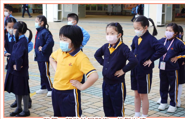
我們一起做伸展動作，放鬆心情