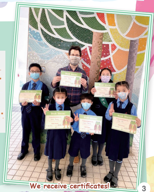
We receive certificates!