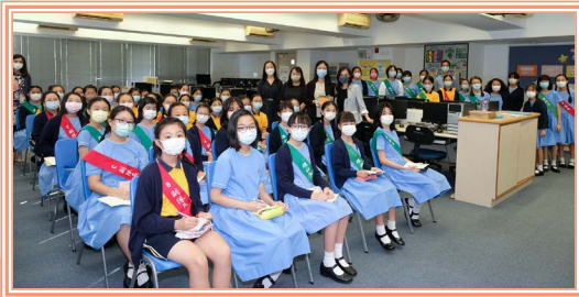
聖潔靈女子中學副校長和老師與我們合照