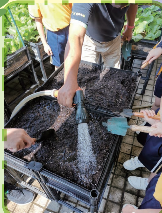
種籽放進已施肥的泥土中