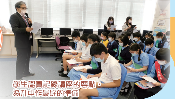
學生認真記錄講座的重點，為升中作最好的準備