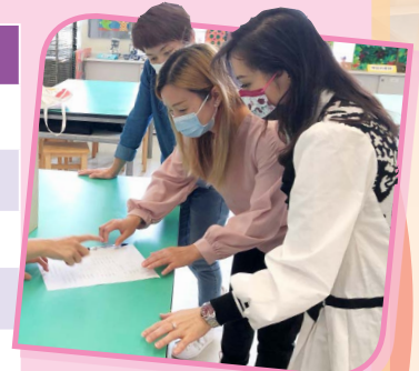
感謝家長參加校董選舉並一同見證投票結果