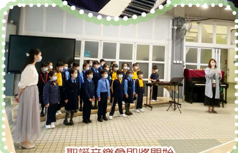
聖誕音樂會即將開始

在低年級歌詠組及熱愛音樂的學生的帶領下，讓大家一同走進聖誕音樂世界，慶賀耶穌的降生。