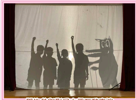
學生參與影子木偶互動表演