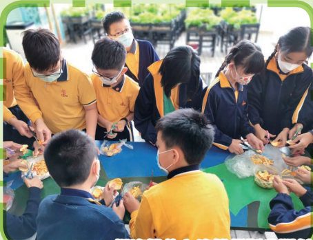
Captain Green把廚餘放入廚餘機製造肥料

本年度有 18 位 Captain Green (環保大使) 為學校環境保護活動出一分力。平日他們在課室內推動減塑、節能，實踐綠色生活，身體力行支持珍惜地球資源。另外，本年度學校與「齊惜福」合作舉辦種植工作坊，在校園小耕地種植芥蘭和羅馬生菜，他們學習把廚餘發酵製成環保肥料，實行自給自足的精神。