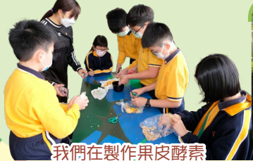
我們在製作果皮酵素