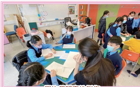
學生們認真地創作