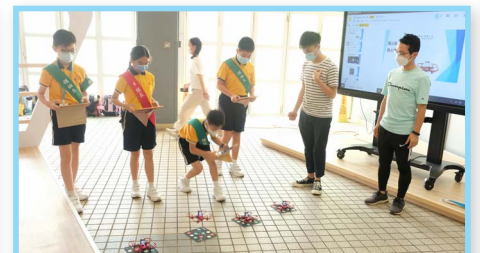
學生努力編程，讓無人機起飛