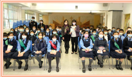
五邑司徒浩中學校長與我們合照