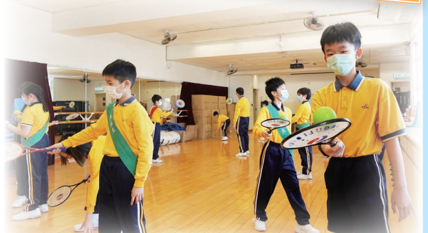
我們初次接觸柔力球，真不容易呢！