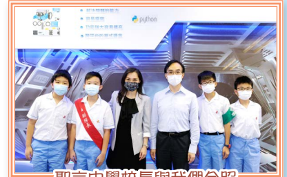
聖言中學校長與我們合照