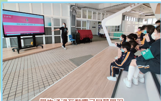
學生通過互動電子屏幕學習