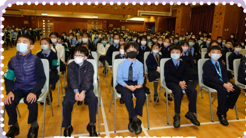
學生們正在參與校慶日崇拜