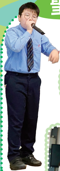
來聽聽 Beatbox 吧！