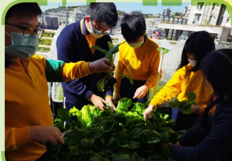
我們種的蔬菜終於可以收成了