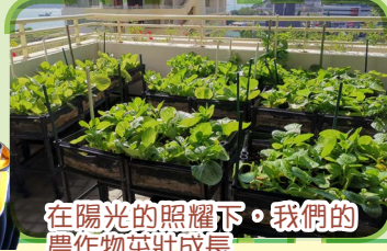
在陽光的照耀下。我們的農作物茁壯成長