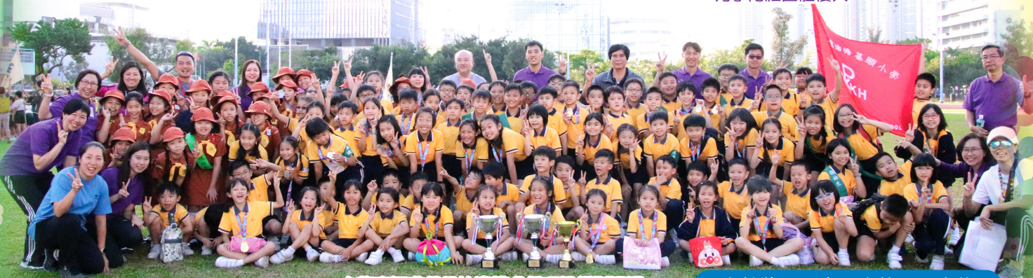
九龍東區遊戲日比賽獲多個項目組別冠軍