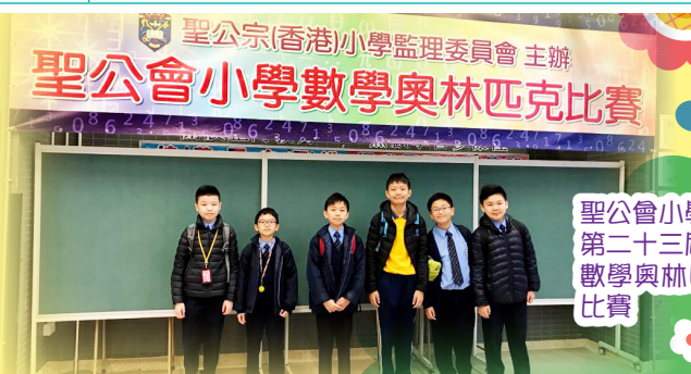
聖公會小學第二十三屆數學奧林匹克比賽