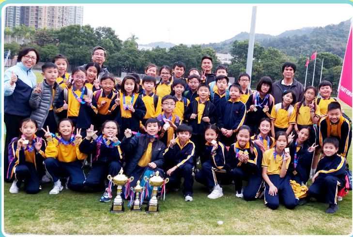
九龍東區小學校際田徑比賽女子甲組及丙組團體冠軍