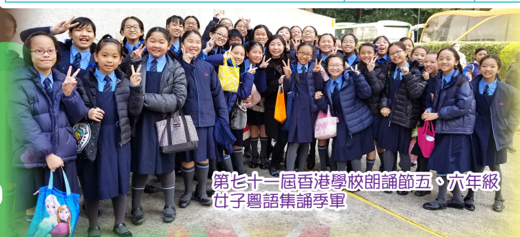
第七十一屆香港學校朗誦節五、六年級女子粵語集誦季軍