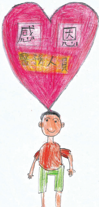
周岱泓 2A (4)

在二零二零年全世界爆發了新型冠狀病毒。這是個人傳人部 險的疫情。我們感恩的是我們一家很健康！感恩香港醫 人員正在前線為我們拼博。謝謝醫務人員。加油！