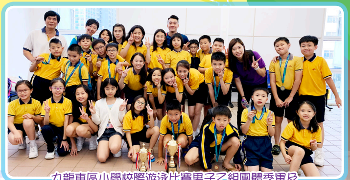
九龍東區小學校際游泳比賽男子乙組團體季軍及 男子丙組團體優異