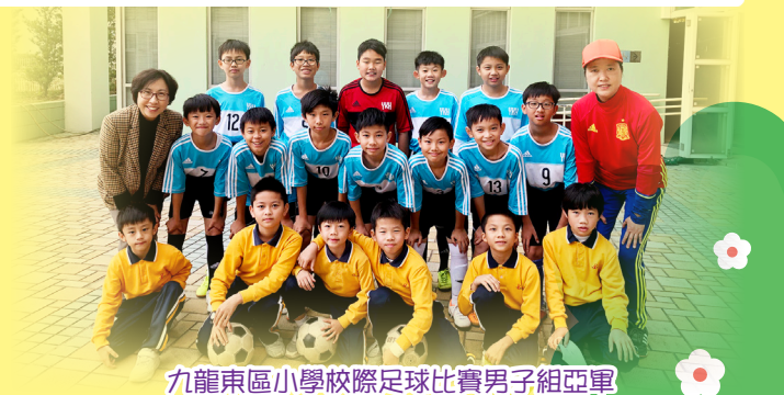
九龍東區小學校際足球比賽男子組亞軍