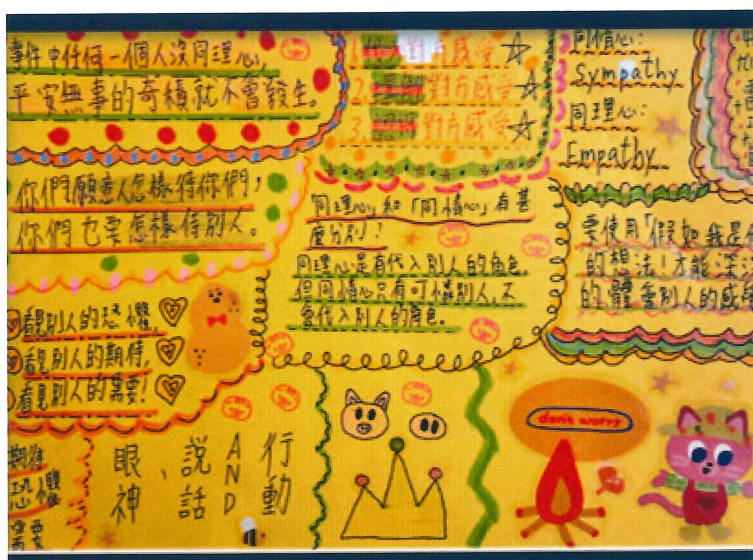
圖中文字是「同理深海」活動後學生的反思：

正向教育的最終目標是幫助學生過上更快樂、更充實的生活。通過倡導同理心、仁慈和其他正向價值觀，校方堅守透過各式各樣活動潛移默化地幫助學生學懂勇於面對困難的應對技巧和建立韌性的方法，期望能幫助減輕學生的壓力和焦慮水平。我們持續推行正向教育，孩子能懷抱着正向的價值觀，凡事從心出發，學懂易地而處，探索人與自然萬物間需要的關懷與尊重。