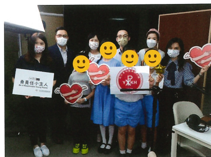
香港電台-負責任小主人錄音

我們相信同理心是一切美好生命特質之源，因為沒有真正願意站在別人位置去感受的心態和能力，一切美德包括尊重、關愛、孝順等等，都容易流於模仿和行為主義，未必真正能觸動和改變彼此的心。正因同理心如此重要，即使復課後課時緊迫，我們仍然大幅調動時間表，制定一系列校內、校外大大小小的活動。我們深信在價值教育中，「知、情、意、行」四要素缺一不可，希望同學可在生活中將品德自覺地實踐出來。