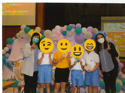
互相勉勵說：永遠支持你!

此外，教師還可以運用小組合作、合作項目或互動遊戲等活動，讓學生在團隊合作中體驗到同理心的重要性。這樣的設計可以促使學生學會聆聽和尊重他人的聲音，並學習如何合作解決問題，從而培養同理心。教師在課堂上可以使用多元化的教學方法，例如討論、問題解決、角色扮演、故事分享等，使學生能夠從不同的角度理解同理心的概念。同時，教師可以提供實際的例子和情境，讓學生在日常生活中應用和實踐所學的知識和技巧。讓學生更深入地理解同理心的重要性，並激發他們在日常生活中實踐同理心的能力。