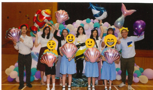
「同理森林」主題體驗週