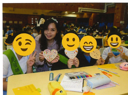
送給將來的我一面對失敗時鼓勵自己的話