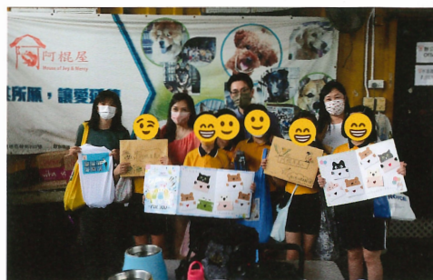
帶着同學的心意卡、製作的蹣狗袋及募捐的狗糧送贈給「阿棍屋」

聖公會油塘基顯小學致力於發展和推行《共建卓悅校園》計劃和課程，並感謝香港大學《共建卓悅校園》計劃的支持。自2016年來，學校一直致力於向學生推廣正向教育，關注學生、家長和教師的心理健康。學校將正向教育與相關事項相結合，通過課程和全校活動，旨在使抽象的品德教育變得更具體，貼近學生的生活，並鼓勵學生在日常生活中應用和實踐所學的知識和技巧。校方相信單純地教導學生正面的價值觀和品德特質是不夠的，更重要的是幫助學生將所學的正向價值觀和技能真正融入他們的生活中，使其成為他們的日常習慣和行為方式。