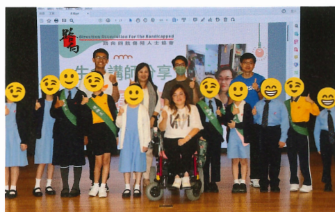
與生命講師交流，學習面對困難如何自處