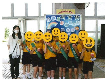
同學每年最喜悅的雪糕環節