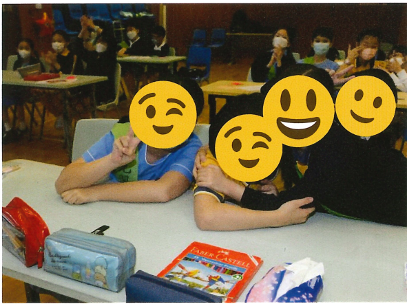
同理心活動 – 學習珍惜彼此

透過校園處境及生活小故事，引導學生思考同理心的意義，讓學生設身處地代入別人的處境，明白及體諒別人難處，學懂給予善良合宜的回應，並叮囑學生珍惜學習的機會，在生活中實踐同理心。校方期望透過各種體驗活動，讓學生學習聆聽和理解別人的想法，並作出合宜的回應，明白需要善待他人，更重要是明白背後的原因，這不是書本或知識層面上的學習，而是通過反思和實踐而得、更內化個人品格的栽培。如學生主動把心中的感動、許多感謝和鼓勵的話語化成文字，藉着一封封短信，向無私照顧小動物的獸醫和義工表達最真摯的謝意和支持，這是個用心思考和真誠表達的過程。